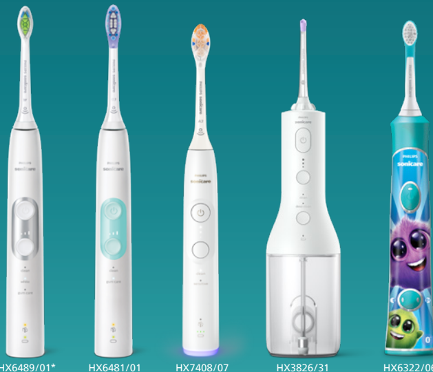
HX6489/01* *ブラシは含まれません。